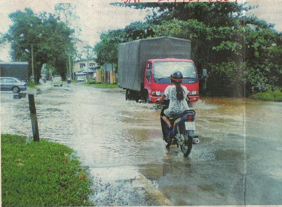
KEADAAN jalan yang mula dipenuhi air selepas hujan lebat melanda Rantau Panjang, semalam.

Oleh Ismail Mat dan Fazurawati Che Lah bhkb@bharian.com.my