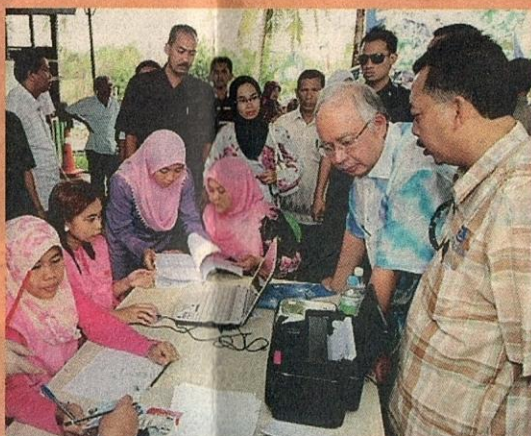
Timbalan Perdana Menteri Datuk Seri Mohd Najib Tun Abdul Razak (dua, kanan) melawat pos panas di Sekolah Kebangsaan Kuala Ibai sempena Pilihan Raya Kecil Kerusi Parlimen Kuala Terengganu di sini, semalam. Pos panas adalah tempat menyemak daftar mengundi dan saluran mana untuk mengundi.