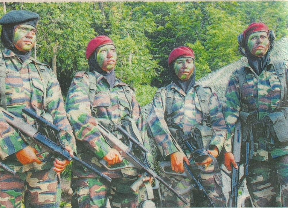
WANITA boleh sertai mana-mana kor jika sanggup hadapi cabaran.

Polisi ATM belum benar wanita di Kor Infantri tetapi mereka boleh lakukan jika berpeluang