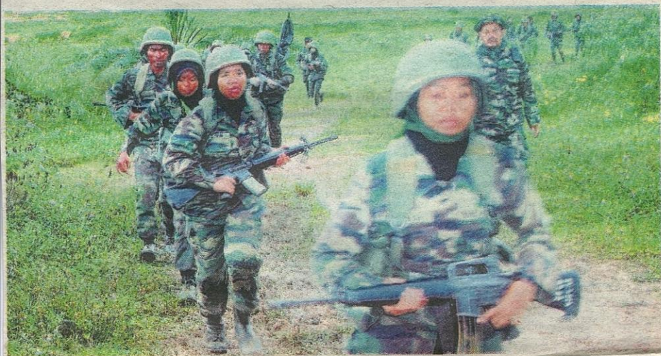
TAK gentar melakukan latihan lasak.