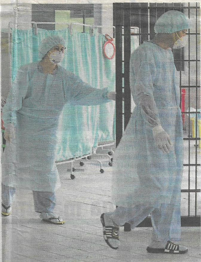
PETUGAS hospital di Kuching bersiap sedia menunggu pesakit yang dijangkiti wabak H1N1.

Menjelas lanjut, Liow berkata, menerusi pelan kebang-