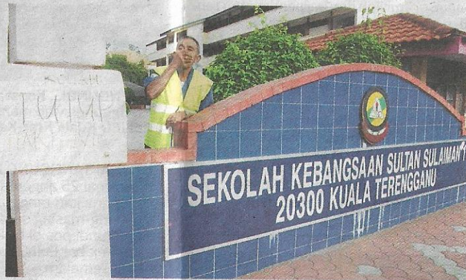
SEKOLAH Kebangsaan Sultan Sulaiman 1, Kuala Terengganu ditutup selama lima hari selepas dua muridnya dijangkiti H1N1.