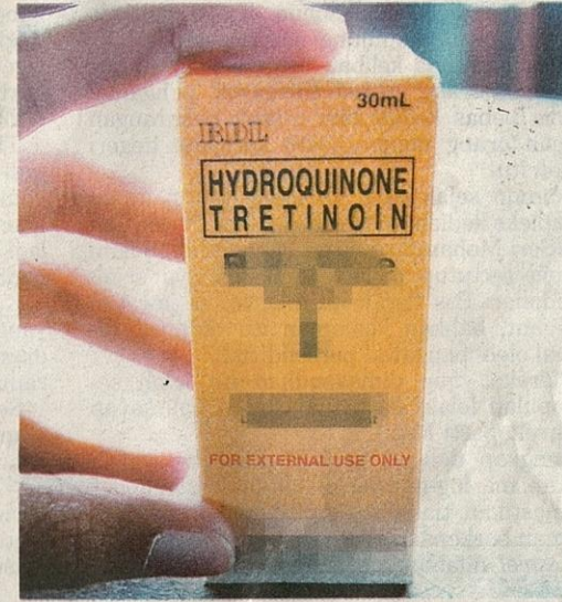
UBAT jerawat dari Filipina ini mengandungi hydroquinone yang turut mempunyai logo 'halal'.