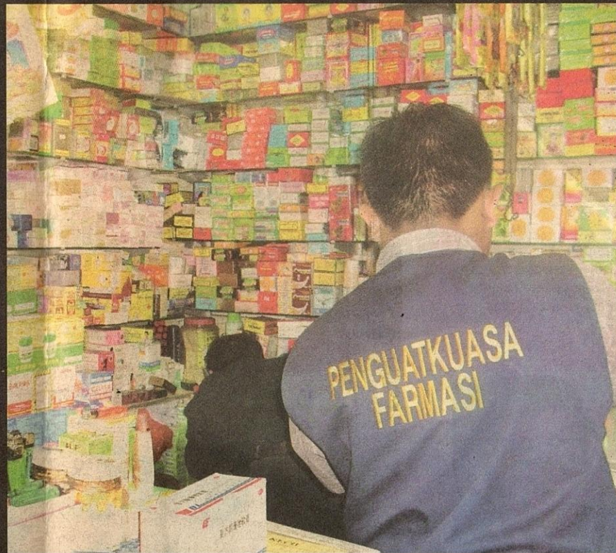
Petugas Penguat Kuasa Farmasi Kementerian Kesihatan memeriksa gerai menjual ubat kuat.

Sehubungan itu, beliau menasihati orang ramai supaya peka dan mengutamakan hak sebagai pengguna apabila membuat pilihan bagi mana-mana produk, terutama yang membabitkan makanan.