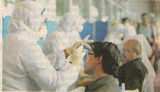
MANGSA kes pertama influenza H1N1 dipercayai terlepas saringan kesihatan di KLIA kerana dia hanya demam sehari selepas tiba dari New York.

Sedunia (WHO) mengesahkan laporan kes pertama di Malaysia itu ketika dihubungi Bernama semalam.