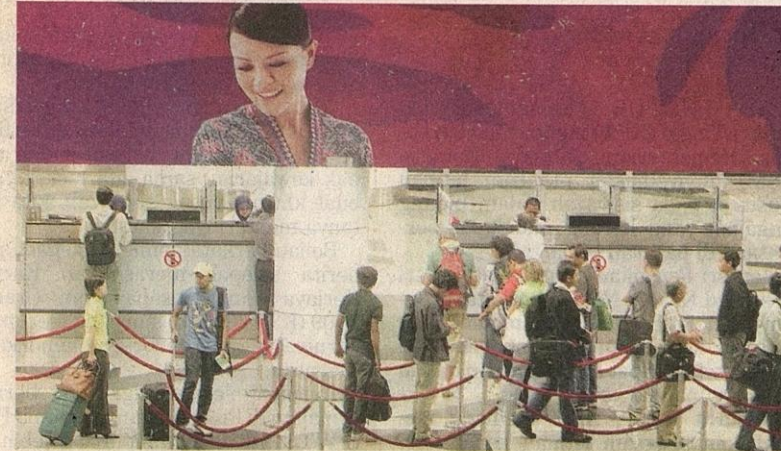
SUASANA di KLIA tetap seperti biasa semalam selepas negara dikejutkan dengan penemuan kes pertama influenza A yang menjangkiti seorang pelajar selepas dia tiba di lapangan terbang itu pada Rabu lalu.

Tiohng Lai turut menasihatkan orang ramai supaya berjaga-jaga dan segera mendapatkan rawatan jika berasa tidak sihat.