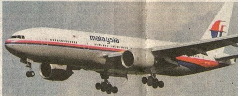
PESAWAT Boeing B 777-200 Penerbangan Malaysia seperti inilah yang dinaiki oleh mangsa pertama influenza A di negara ini. Mangsa tiba di KLIA pada Rabu lalu.

Katanya, MAS juga akan meneruskan kerjasama dengan kementerian berkenaan bagi memantau dan membuat saringan ke atas penumpang dan krew pesawat sebagai langkah pencegahan wabak daripada merebak.