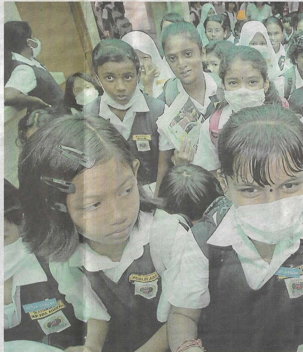
H1N1 dan dinasihatkan segera mendapatkan rawatan jika terdapat simptom penyakit itu.

Katanya, mereka tidak termasuk 43 pelajar sebuah kelas dan 12 guru sekolah sama yang diarah tidak datang ke sekolah selama seminggu mulai semalam, untuk tujuan