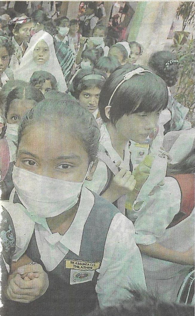
SEBAHAGIAN pelajar SRK Assunta 1 dan 2, Petaling Jaya (gambar bawah) memakai topeng muka ketika menghadiri persekolahan sebagai langkah berjaga-jaga jangkitan wabak H1N1.