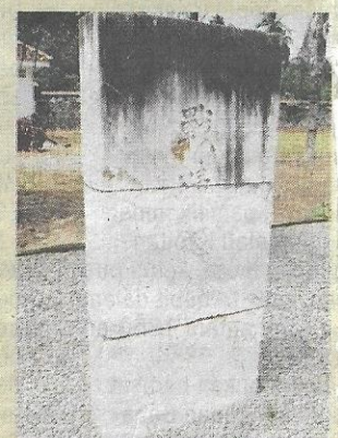
TERKESAN... tugu peringatan Jepun.