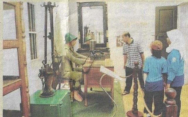
TERTARIK... pengunjung melihat bahan pameran dengan lebih dekat.