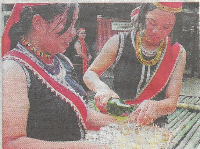
MINUM... tuak beras disajikan kepada pengunjung Rumah Panjang Bidayuh di Anah Rais.