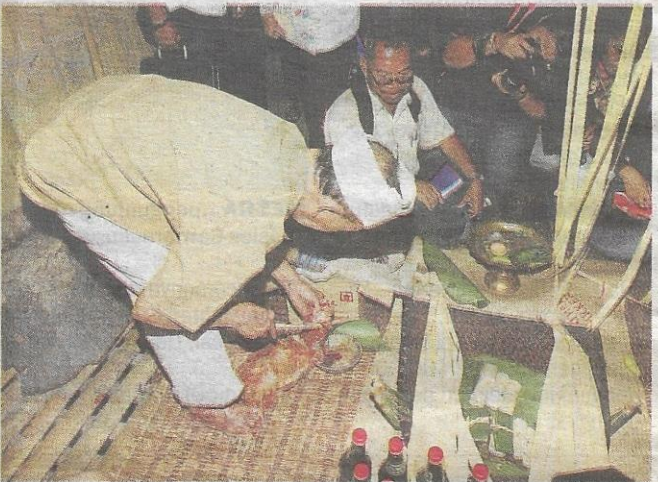
ADAT... upacara miring dipersembahkan kepada orang ramai di Anah Rais.