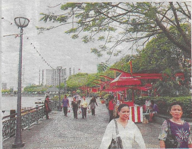
DAMAI... pelbagai aktiviti penduduk tempatan boleh dilihat di Kuching Waterfront.