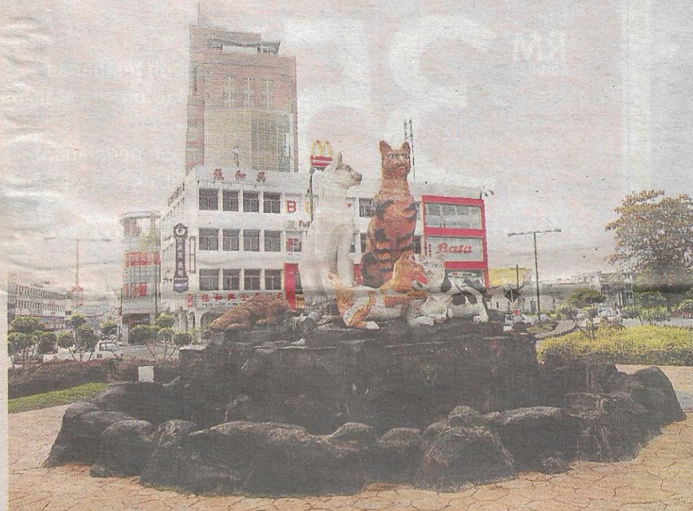
MERCU TANDA... replika kucing menjadi tarikan di tengah bandar raya Kuching.