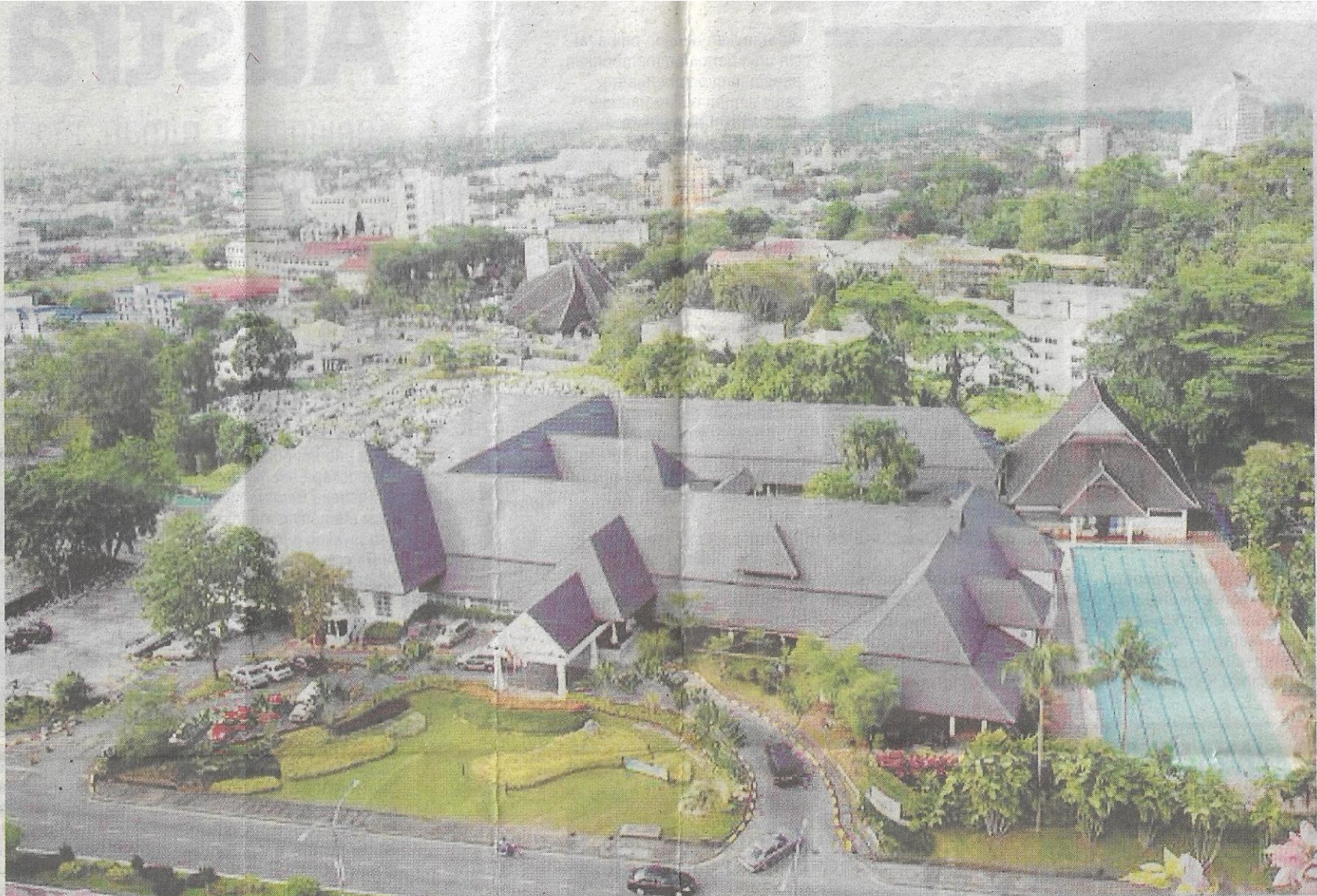
SAUJANA... pemandangan indah bandar raya Kuching.