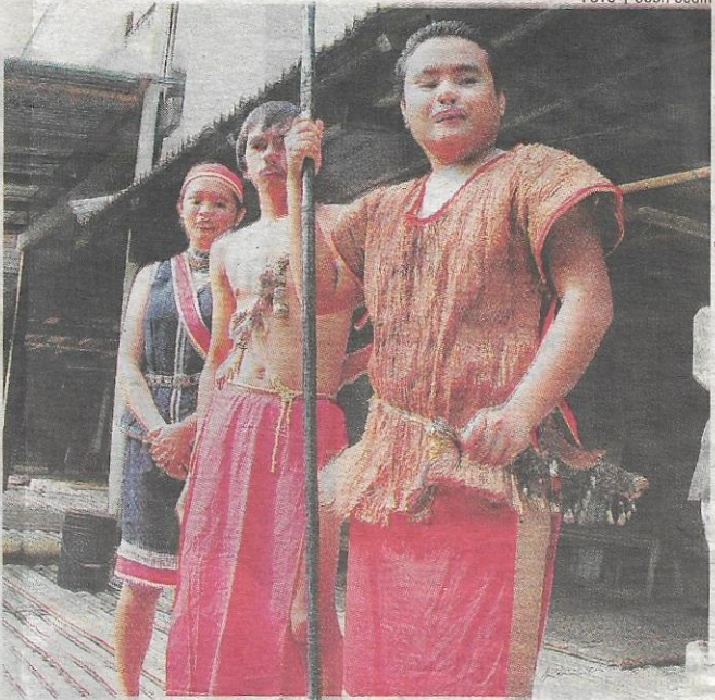
WARISAN... pemuda dan gadis Bidayuh memakai pakaian tradisi mereka.