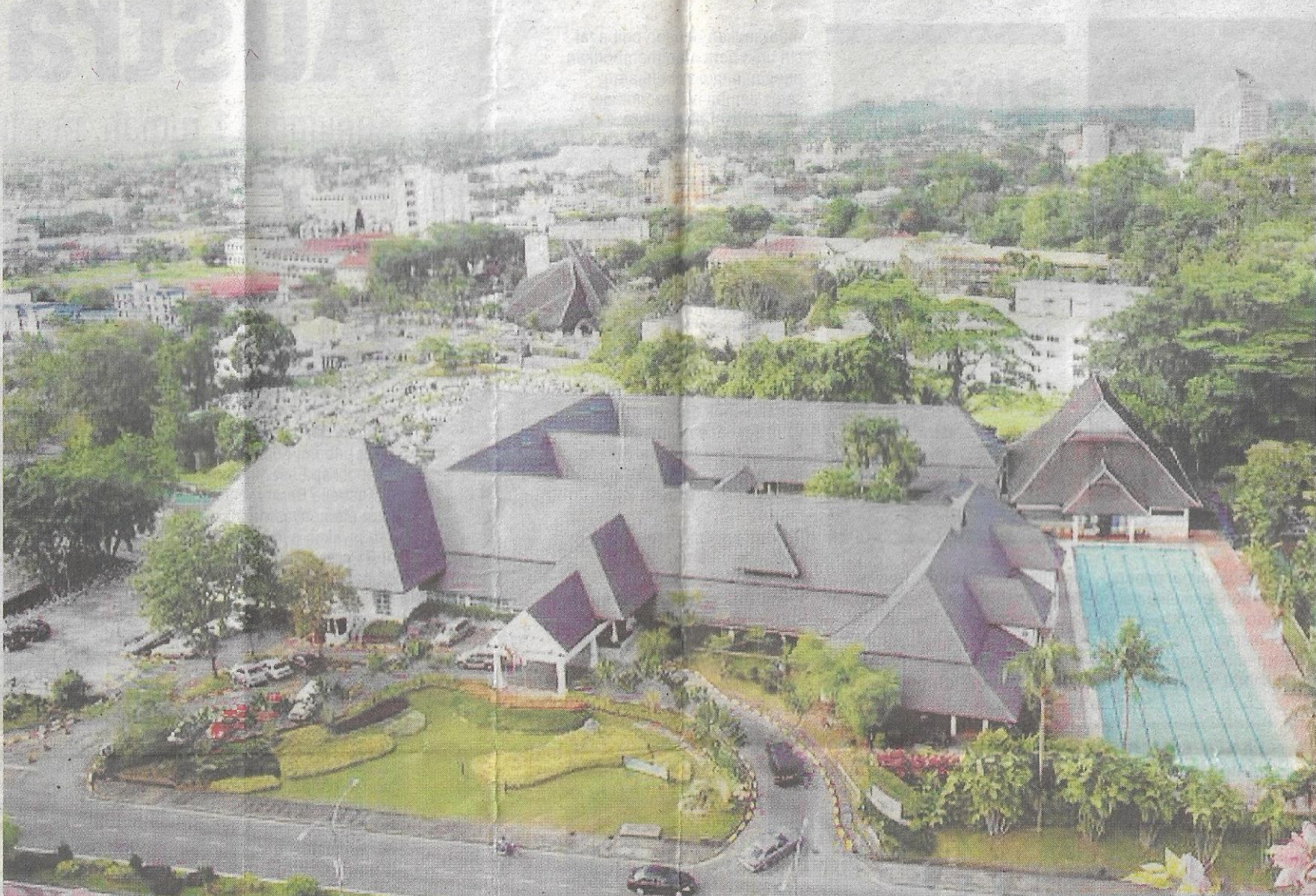
SAUJANA...pemandangan indah bandar raya Kuching.