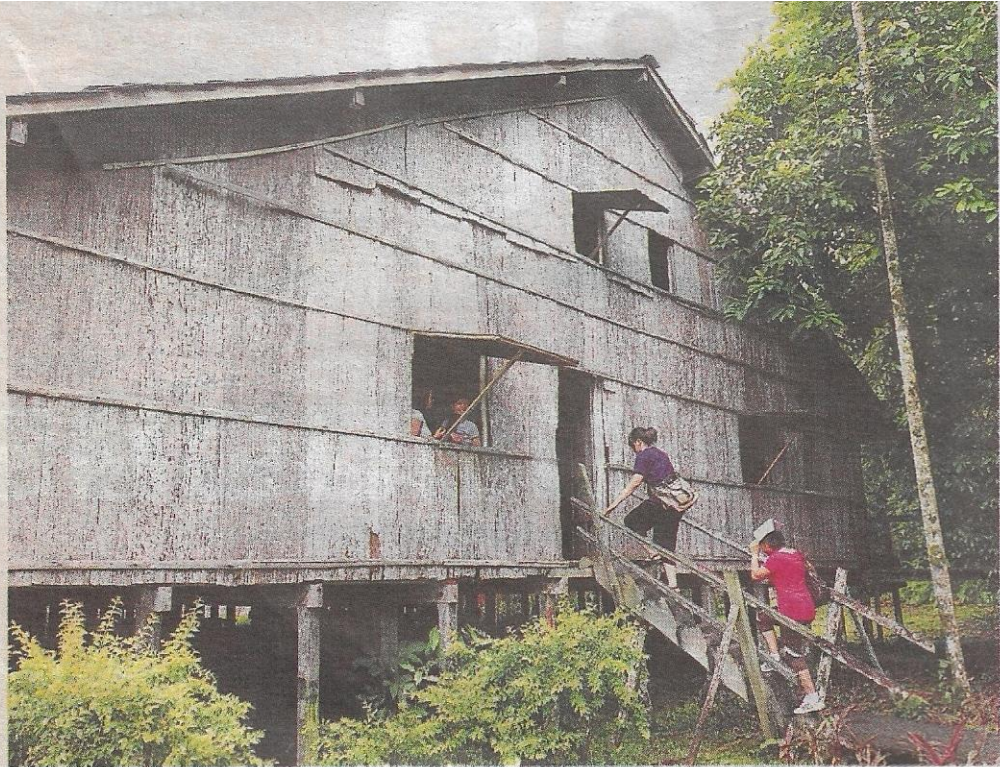
PELBAGAI... antara binaan rumah panjang mengikut etnik di Kampung Budaya Sarawak.