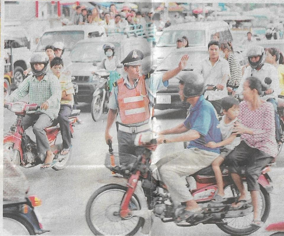
KESESAKAN lalu lintas juga antara masalah yang dihadapi oleh penduduk di Siem Reap.

← sungai Siem Reap yang mengalir dari utara ke timur Kemboja, Siem Reap memiliki daya tarikan tersendiri. Lebih-lebih lagi, berhubung era kemasyhuran dan kejatuhan empyar Angkor.