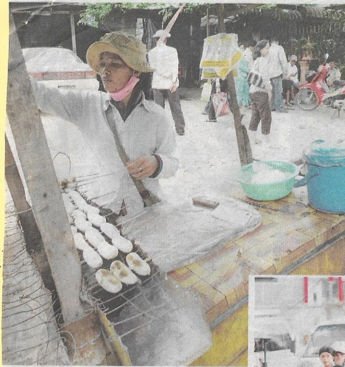
ENDUDUK Khmer menyara hidup dengan erniaga secara kecil-kecilan.