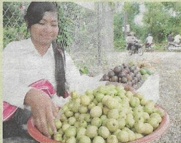
SALAH satu pemandangan biasa di Siem Reap.

■ Bulan November atau Disember: Perayaan Angkor