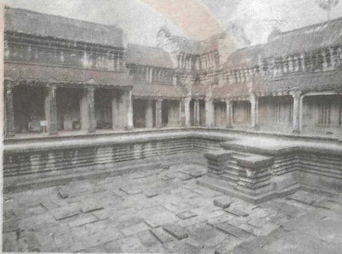
BAHAGIAN dalam Angkor Wat yang masih terpelihara.

ANGKOR WAT yang dibina pada awal kurun ke-12 ini masih utuh struktur bangunannya.