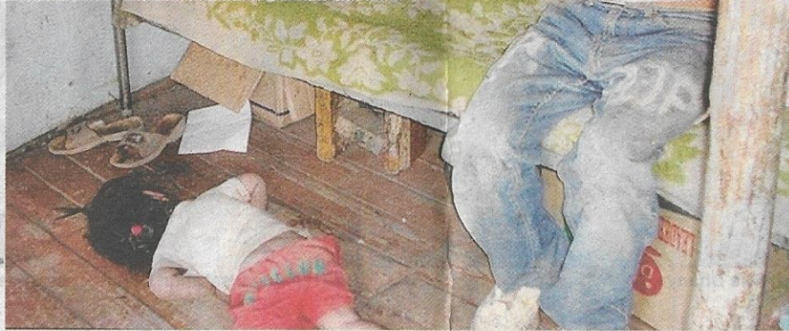
KANAK-KANAK ini tertiarap kerana sakit.