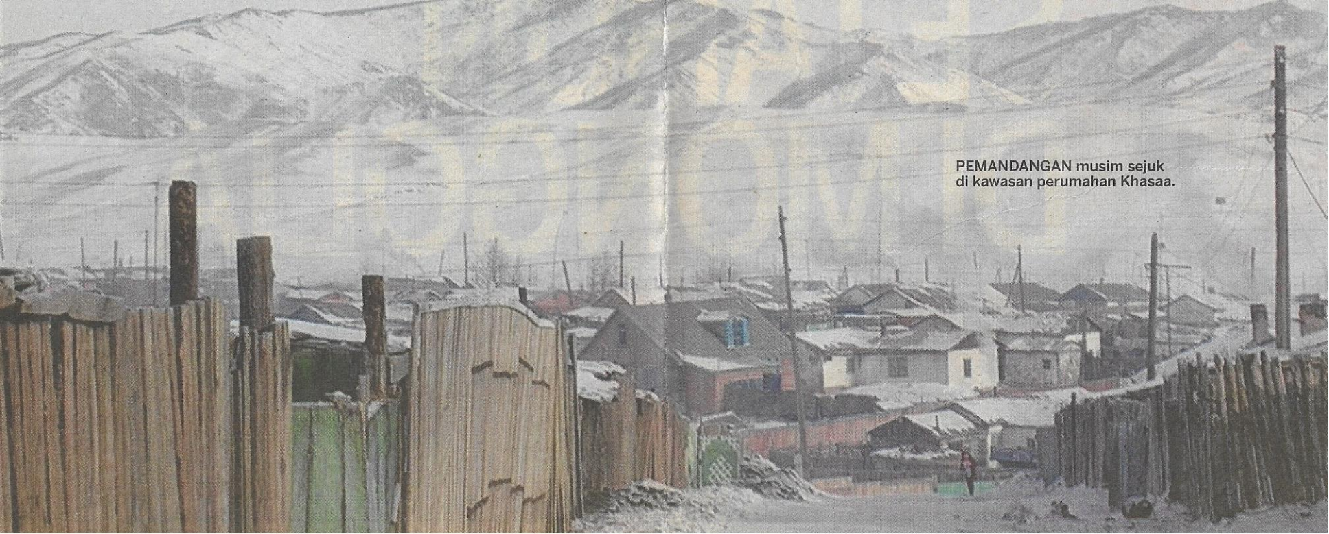
PEMANDANGAN musim sejuk di kawasan perumahan Khasaa.