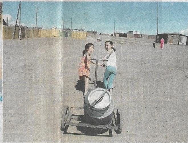
PEMANDANGAN kanak-kanak menolak kereta sorong berisi tong air adalah perkara biasa di Nalaikh.