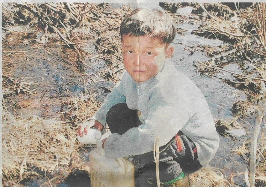
KETIADAAN bekalan air memaksa kanak-kanak ini mendapatkan air dari lopak.

berusia 34 tahun itu menjadi saksi kepada segala kedaifan dan kepayahan hidup penduduk tempatan Mongolia. Mereka juga menjadi testimoni bahawa kebahagiaan tidak semestinya diukur dengan wang ringgit.