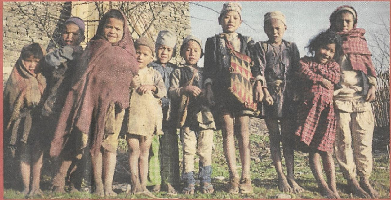
KANAK-KANAK Nepal turut menjadi mangsa perdagangan manusia.

Pejuang hak asasi manusia sedia program atasi eksploitasi wanita dan kanak-kanak untuk seks