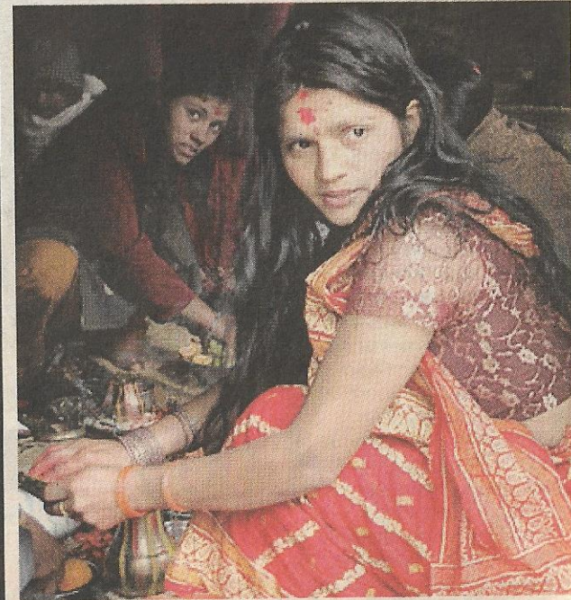
GADIS muda kurang kesedaran mengenai eksploitasi seks ke atas mereka.