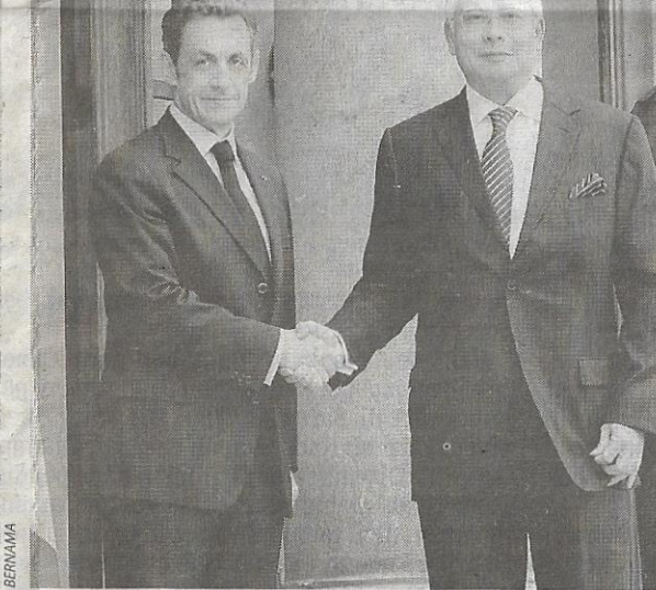
NAJIB bersama Sarkozy ketika mengadakan pertemuan dengan Presiden Perancis itu Oktober lalu.

seperti digambarkan oleh Susilo yang memilih Malaysia sebagai negara pertama untuk dilawatnya pada Oktober selepas mengangkat sumpah jawatan bagi penggal kedua.