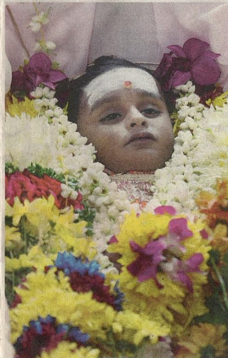
HARESVARRAN mati akibat penderaan teruk pada rusuk dan hati di Damansara semalam.

Jelas beliau, pasangan yang berusia 42 dan 23 tahun itu tidak membuat laporan polis berhubung kejadian tersebut sebelum ini walaupun curiga dengan kecederaan pada tubuh badan mangsa kerana tidak mempunyai bukti.