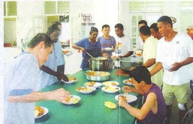
Penghuni diberi makanan yang baik dan menyihatkan.