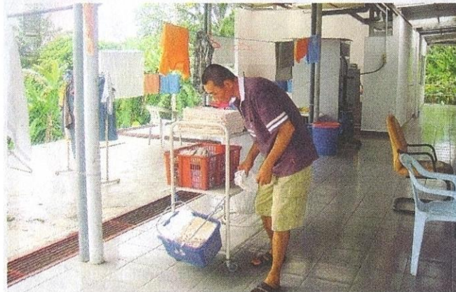
Setiap penghuni digalakkan melakukan kerja-kerja ringan.

Peruntukan diterima daripada Majlis Aids Malaysia (MAC) dan komuniti Katolik itu sendiri.