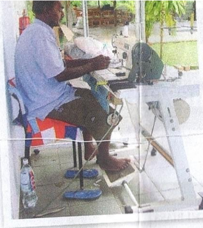
Menjahit menjadi salah satu aktiviti penghuni di sini.