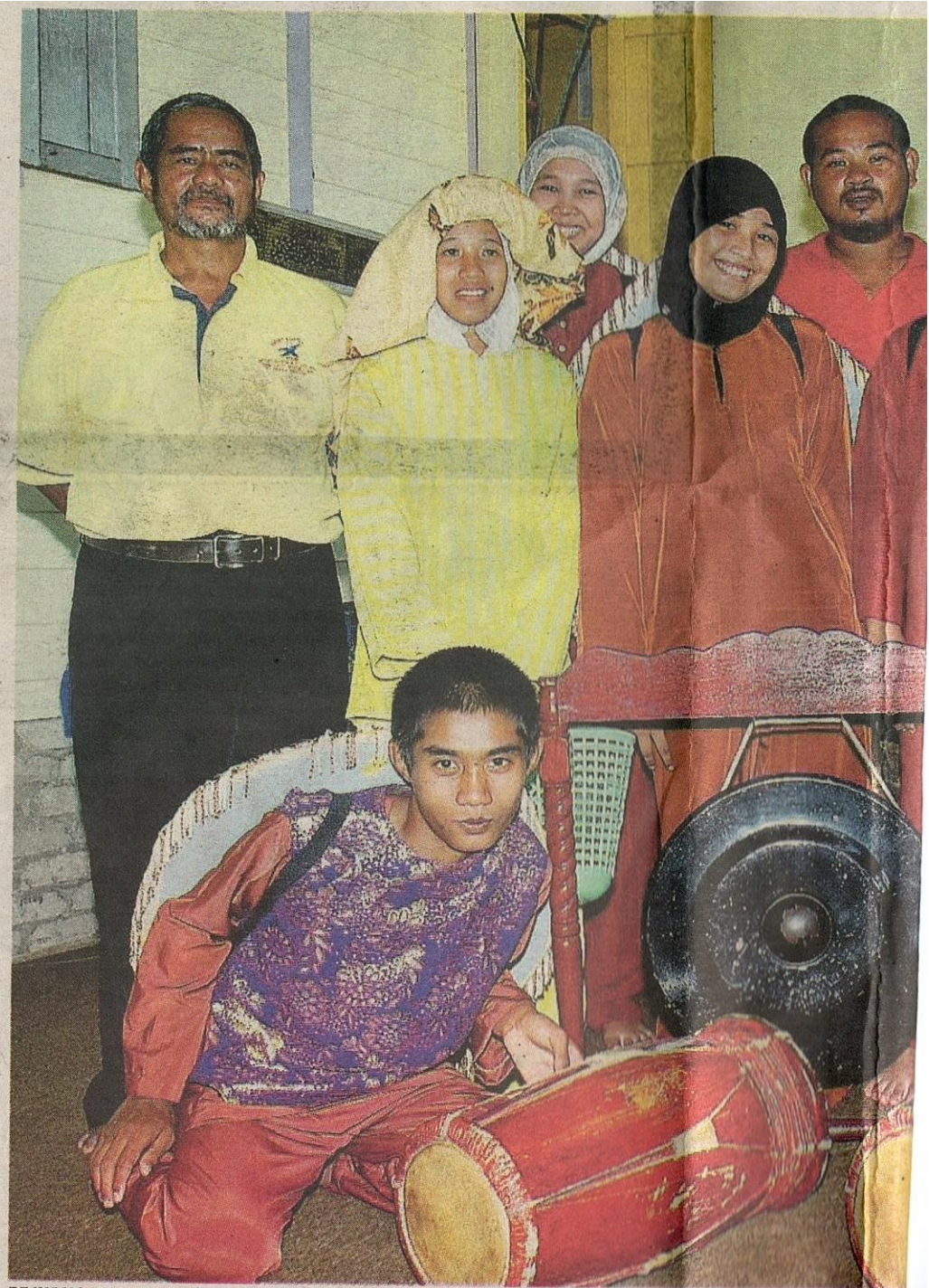
PEJUANG BUDAYA...Ahli Kelab anak-anak Warisan mengabadikan kenangan bersama pengurus mer