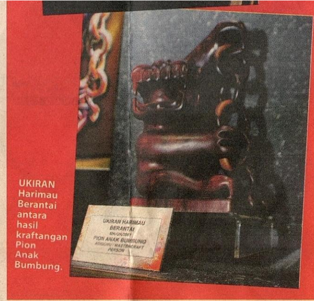
UKIRAN Harimau Berantai antara hasil kraftangan Pion Anak Bumbong.

“Sokongan terhadap hasil kraf tempatan yang memerlukan ketelitian tinggi seharusnya terus dihargai dan dimartabatkan oleh masyarakat. Lantaran itu, generasi muda juga perlu mewujudkan perasaan minat dan menyintai produk kraf tempatan,” kata Parbiyah.