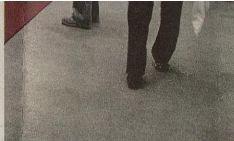
PESTA Buku Antarabangsa Frankfurt di Jerman membuka peluang kepada UP&D untuk menimba idea-idea baru penerbitan buku.

Tambahnya, terdapat pelbagai trend baru dari segi reka bentuk buku, reka bentuk kulit, jenis cetakan dan penjilidan yang lebih kreatif dan mampu menarik lebih ramai pembaca boleh dipelajari di Frankfurt. Selain kualiti persembahan yang menarik, kandungannya jelas menunjukkan perbezaan yang ketara berbanding bahan-bahan tempatan.