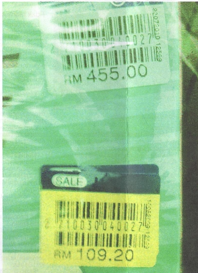
Perbandingan harga yang agak 'melampau' sebelum dan selepas jualan promosi. Perhatikan tarikh yang tertera pada kedua-dua label.