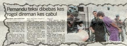
Pemandu teksi dibebaskan kes rogol direman kes cabul