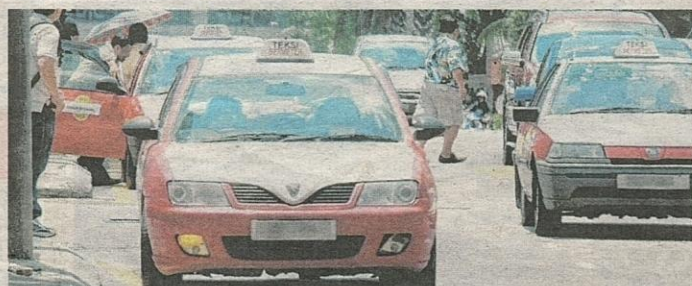
KUALA LUMPUR dianggarkan mempunyai 31,000 buah teksi yang memberi khidmat kepada warga kota. - Gambar hiasan