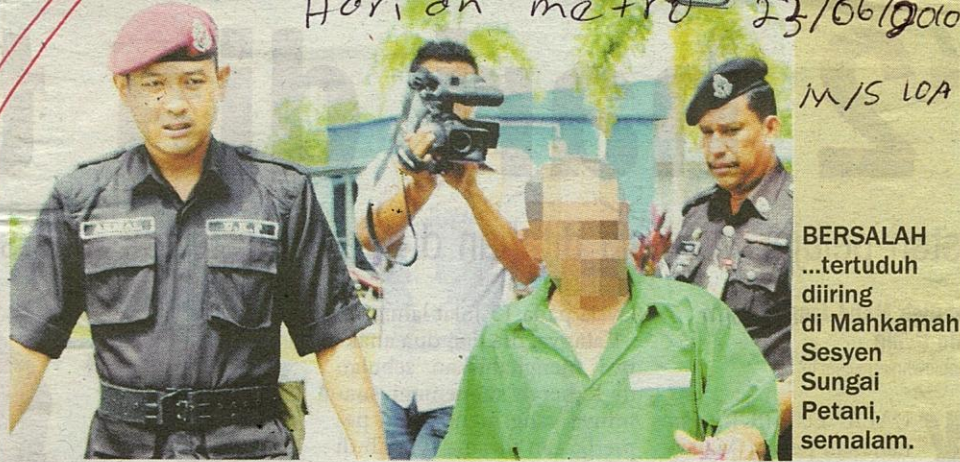
BERSALAH ...tertuduh diiring di Mahkamah Sesyen Sungai Petani, semalam.