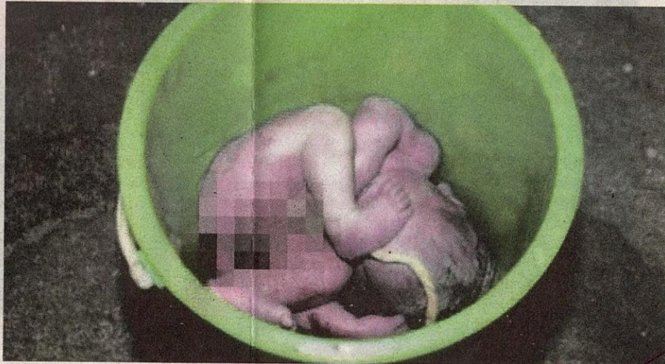
● Bayi dibuang dalam baldi.