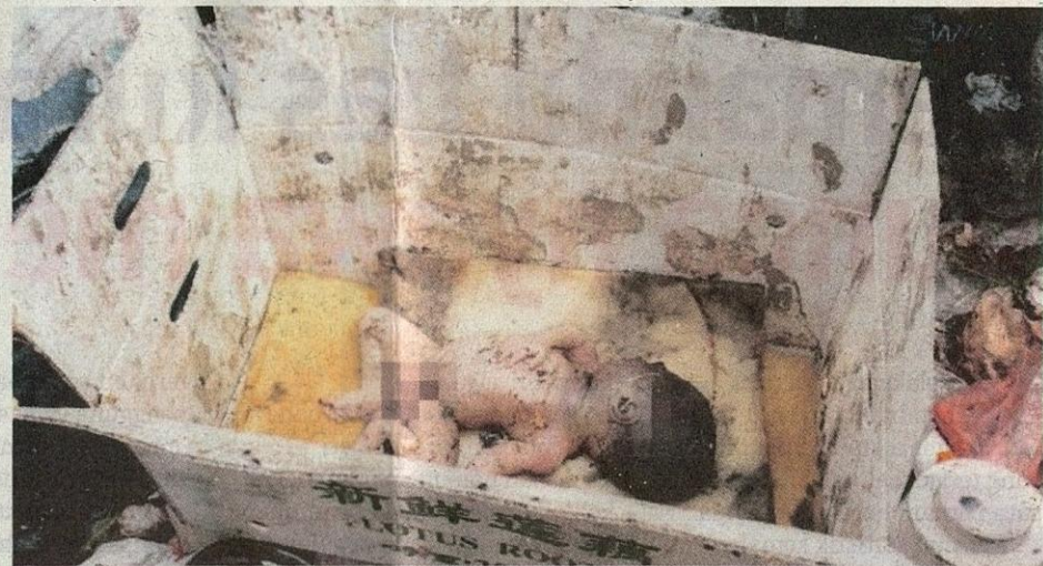
● Bayi dibuang dalam kotak bersama sampah sarap.