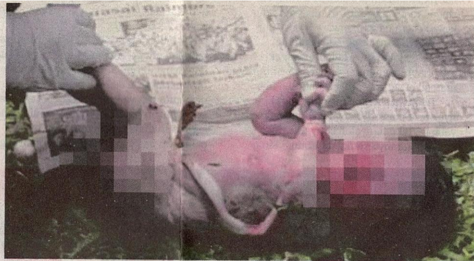
● Nyawa bagaikan tidak berharga.