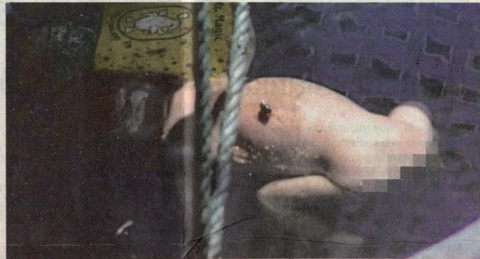
● Bayi malang lemas dalam air.