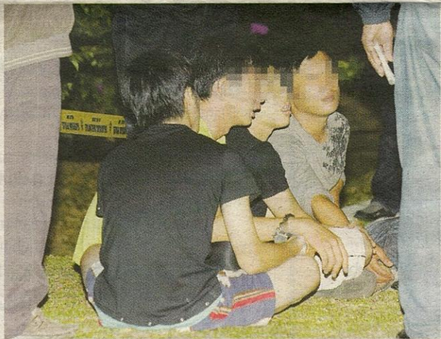
EMPAT suspek yang ditahan polis bagi membantu siasatan.

mereka yang bertanggungjawab atas kematiannya.