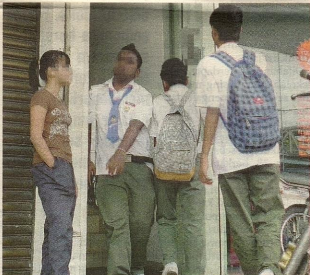
BEBAS...pelajar keluar dan masuk ke sebuah kafe siber di Jalan Ipoh.