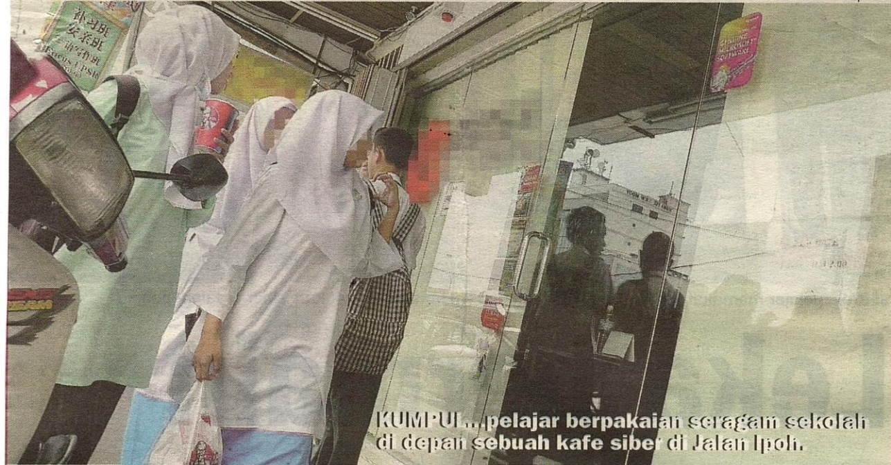
KUMPU... pelajar berpakaian seragam sekolah di depan sebuah kafe siber di Jalan Ipoh.