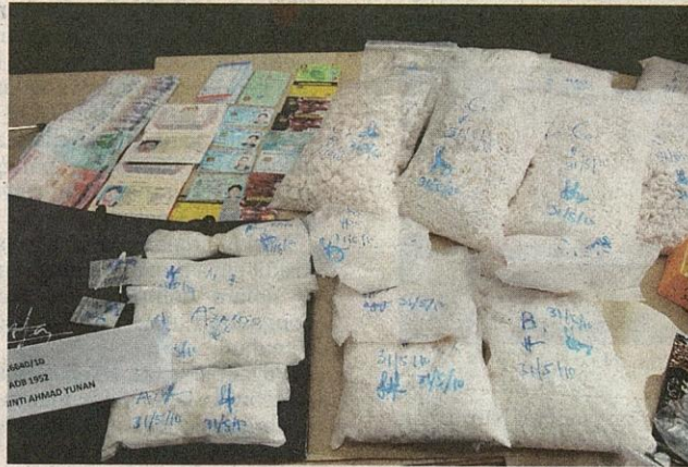
SEBAHAGIAN dadah yang dirampas di Apartmen Anggerik Villa di Jalan Semenyih, Kajang Ahad lalu.

Polis juga menemui 42 butir peluru dan merampas sebuah kereta Ford dan Toyota Alphard di rumah banglo ter-