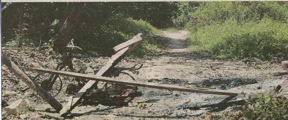
■ Rangka motosikal yang dibakar, namun tinjauan baru-baru ini mendapati ia telah dialihkan.