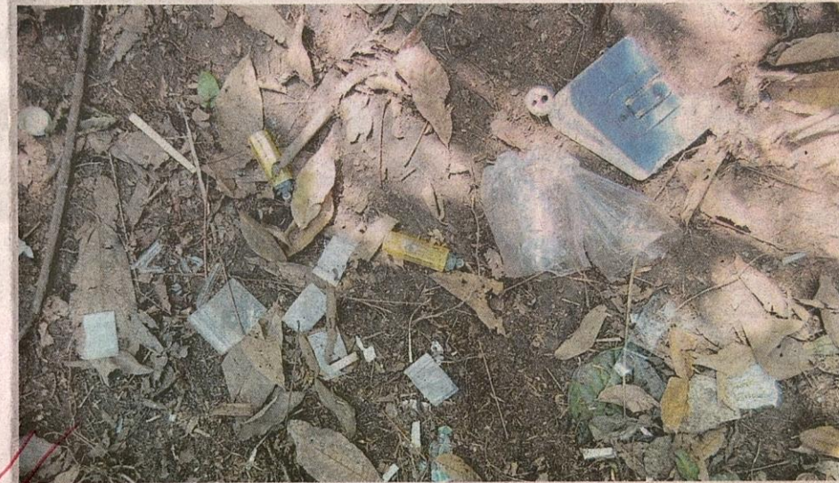
■ Bekas plastik, tiub, daun tembakau yang mencurigakan.