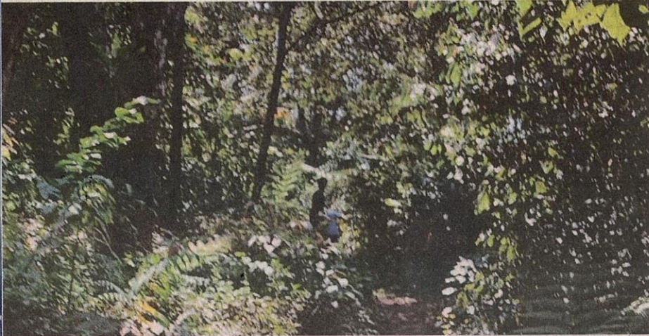
■ Beberapa lelaki melarikan diri ketika tinjauan Sinar Harian bersama jawatankuasa JKP Zon 19.

“Kita sentiasa berjumpa penduduk yang mengetengahkan perkara ini, terutama berkaitan penyalahgunaan dadah dan tindakan telah kita ambil terhadap penagih ini, termasuk dalam kes ini,” katanya.