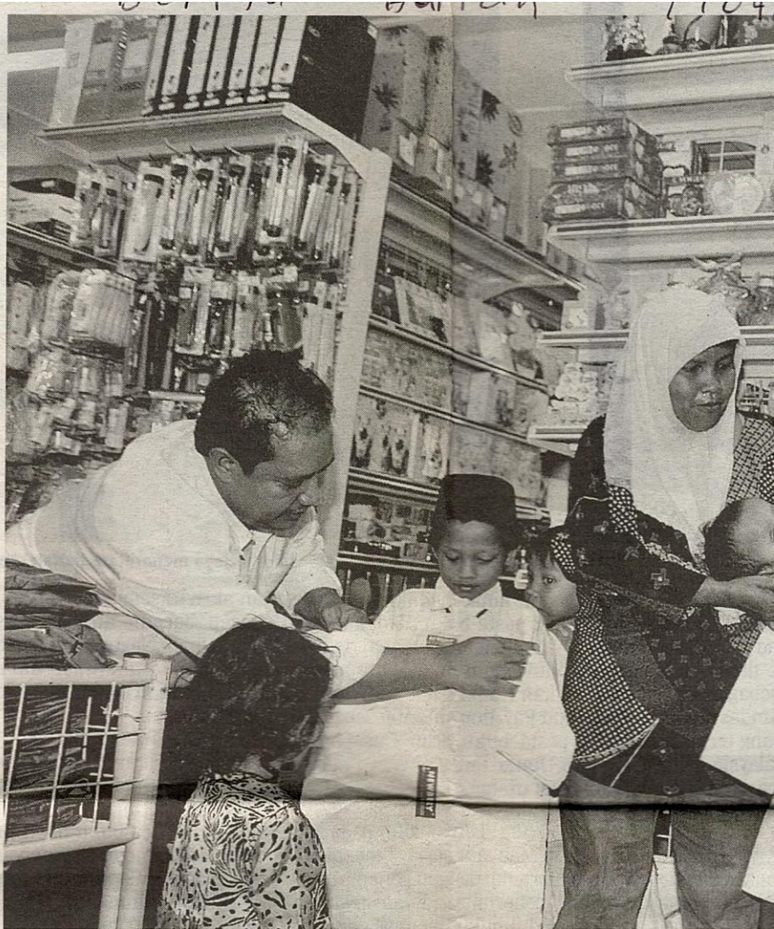
GST digubal bertujuan meringankan beban rakyat keseluruhannya, terutama kumpulan ra

Pengguna, yang membayar cukai perlu diberi jaminan bahawa kadar GST tidak akan dinaikkan melebihi empat peratus yang disarankan bagi tempoh pelaksanaannya, adalah munasabah.