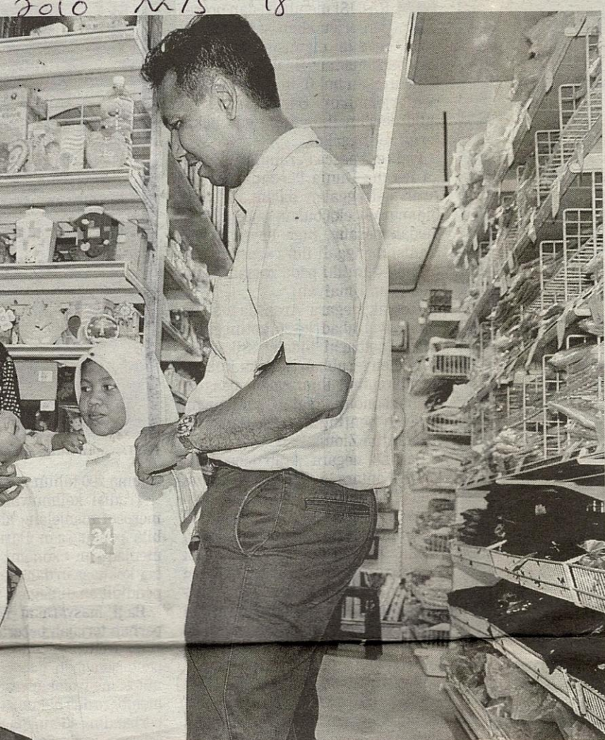
vat yang miskin dan berpendapatan rendah.

mungkin sesuatu yang sukar difahami bagi banyak pihak.