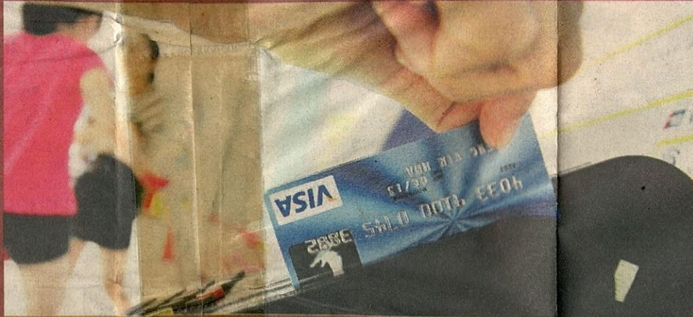
PENGUNAAN kad kredit turut pengaruhi kitaran ekonomi.

al pertumbuhan walaupun tidak begitu pesat