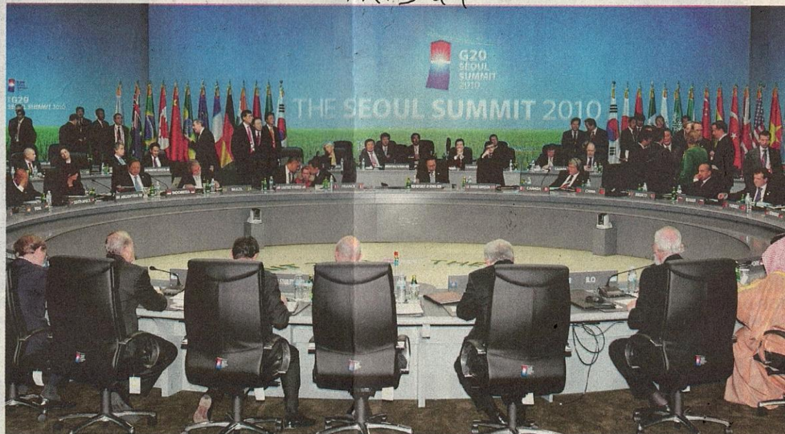
GAMBAR menunjukkan pemimpin-pemimpin anggota Kumpulan 20 duduk di meja persidangan di Seoul, Korea Selatan semalam.

Antara anggota Kumpulan G-20 ialah AS, Brazil, China, Indonesia, India, Jerman dan Kesatuan Eropah.