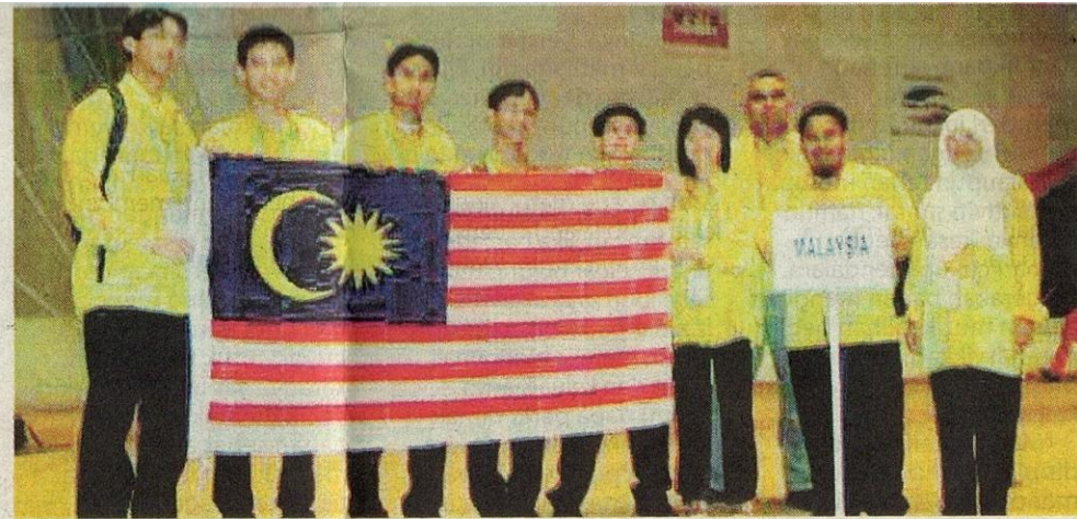
Pelajar SAS ketika mewakili Malaysia ke International Mathematical Olympiad di Hanoi, Vietnam.

Selain gah kokurikulum, SAS terkenal dengan keceMERLANGAN akademiknya. Penilaian Menengah Rendah (PMR) baru-baru ini mem-