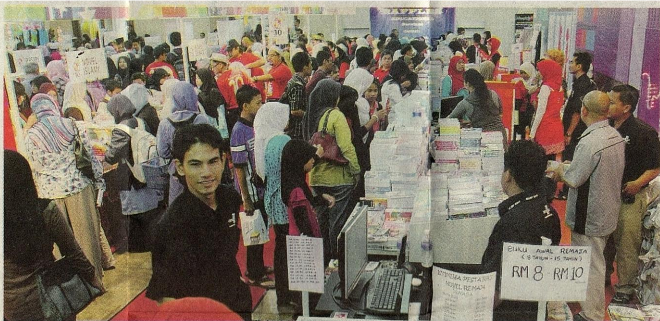
ORANG ramai mengunjungi Pesta Buku yang berlangsung sehingga 28 Mac ini di PWTC, semalam.