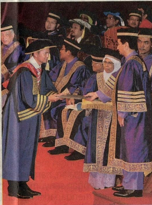
● Adzrool menerima skrol daripada Yang di-Pertuan Agong, Tuanku Mizan Zainal Abidin.

"Selain itu, ini sajalah hadiah yang dapat saya berikan kepada ibu bapa atas segala usaha mereka membesarkan saya," katanya yang kini bertugas sebagai pensyarah di