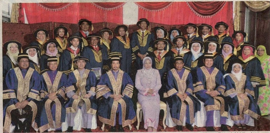
● Penerima ijazah Doktor Falsafah bergambar bersama Yang di-Pertuan Agong, Tuanku Mizan Zainal Abidin dan Permaisuri Agong.

Istiadat Konvokesyen kali ini menyaksikan seramai 15,117 graduan menerima diploma, ijazah sarjana dan sarjana masing-masing yang berlangsung selama 10 hari.