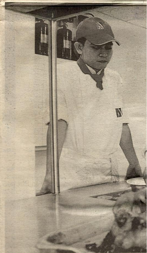
PELAJAR dalam Pengurusan Hotel dari Kampus Ant

"Peluang untuk lulus dalam jurusan peringkat diploma pula tinggi. Ketika ini mereka