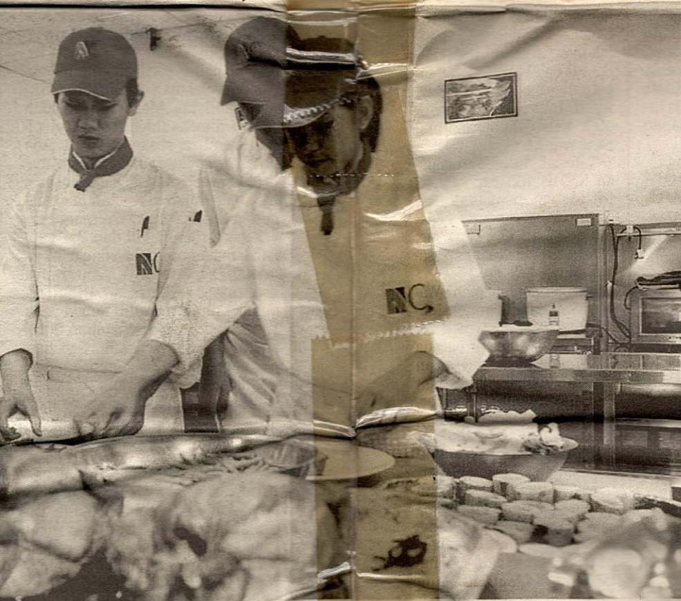
Arabangsa Nilai sedang menjalankan latihan praktikal mereka di sebuah restoran.

tidak ditawarkan jurusan diminati di universiti