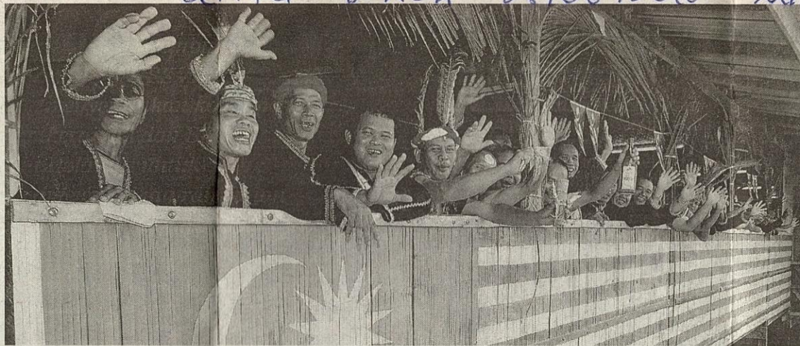
GAMBAR HIASAN | BERITA HARIAN

Selain bangunan Prasekolah Rumah Panjang Kampung Sapak di Pantu, tiga lagi prasekolah rumah panjang yang dibina kemENTERIannya di Sarawak dan sudah pun siap ialah di Rumah Amit, Sungai Sebungan, Sebauh; Rumah Long Laiti, Baram; dan Rumah Lubin, Sungai Bendar, Sebauh.