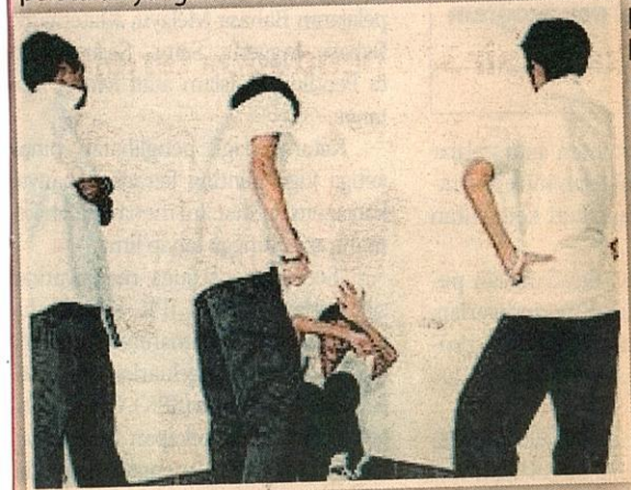
Gejala buli dalam kalangan remaja memerlukan kerjasama semua pihak mencari jalan penyelesaian. - GAMBAR HIASAN