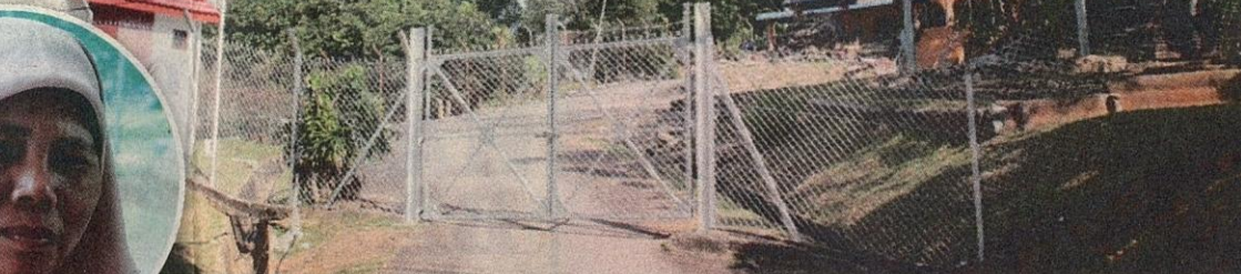
● Sekolah Harapan iaitu sekolah khas untuk pelajar hamil yang terletak di Jalan Pegawai, di sini hari ini.