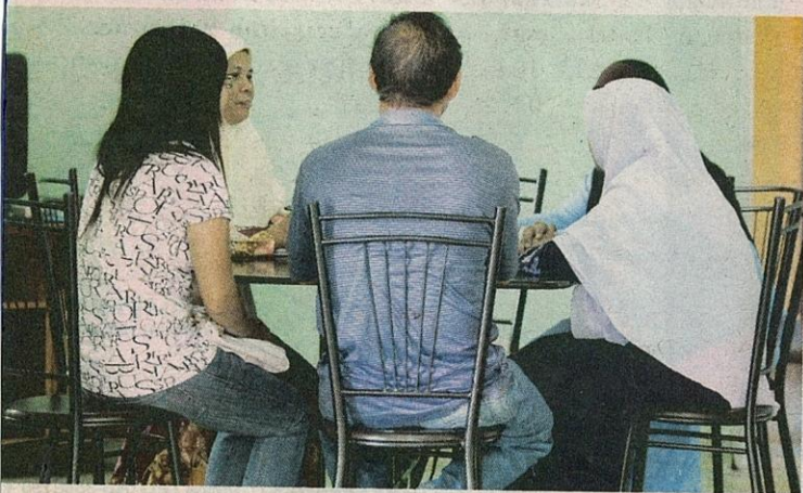
Ibu bapa pelajar yang ditemuduga kakitangan Sekolah Harapan.

Menurutnya, sekolah yang diperkenalkan oleh kenalan ibu bapanya itu memberi peluang kedua kepada remaja yang senasib dengannya untuk meneruskan kehidupan.