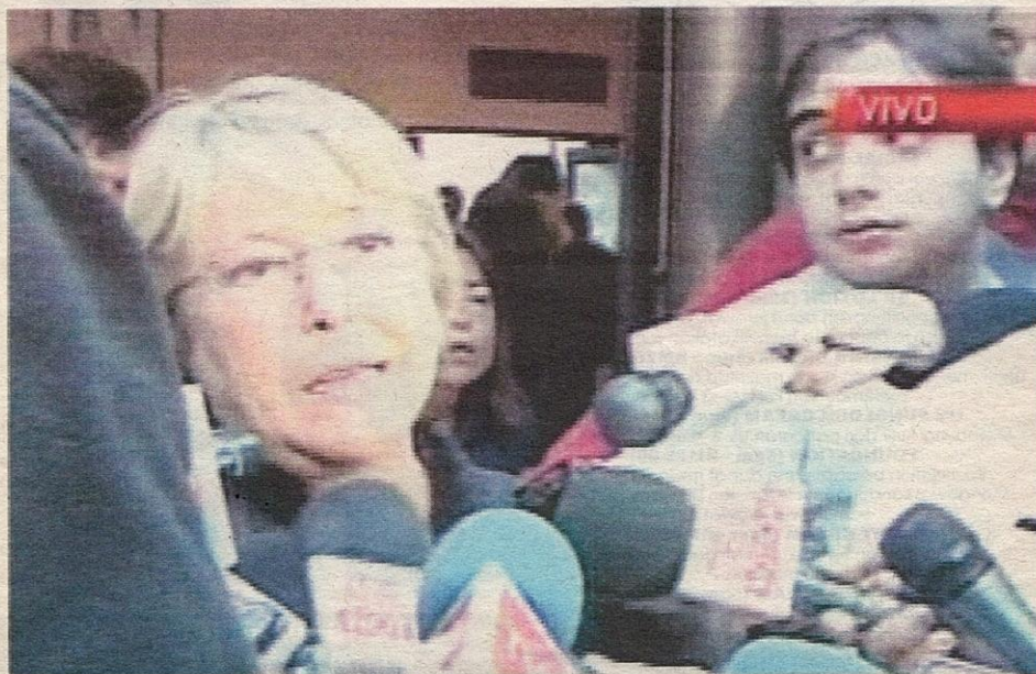
BACHELET ketika ditemuramah wartawan sejeurus gempa bumi terburuk di Chile semalam mengisytiharkan negara itu kini dalam keadaan bencana.