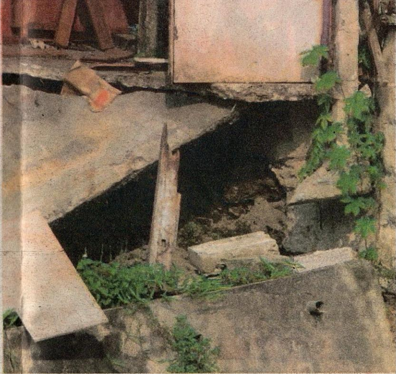
● Lubang yang terhasil apabila bahagian bawah tanah terhakis.

Mesyuarat Jawatankuasa Kecil Infrastruktur dan Lalu Lintas Jabatan Pengairan dan Saliran menyatakan tidak mempunyai bajet.