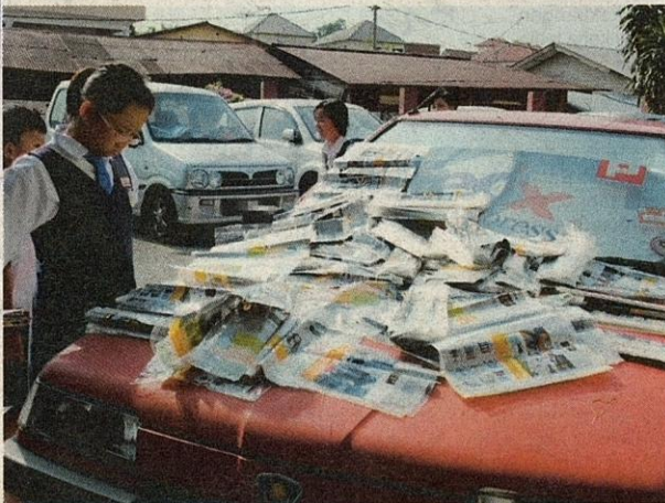
● Seorang pelajar melihat fail yang kebanyakannya basah disebabkan banjir.

“Kejadian banjir itu telah meninggalkan sisa lumpur sehingga menjadi selut tebal tetapi kerja pembersihan telah mendapat kerjasama daripada bomba dan penyelamat Kajang dan Serdang.”