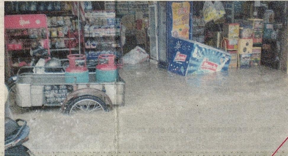
● Peti sejuk dihanyutkan air dan beralih dari tempat asal dalam kejadian banjir berkenaan.

“Kejadian banjir itu telah meninggalkan sisa lumpur sehingga menjadi selut tebal tetapi kerja pembersihan telah mendapat kerjasama daripada bomba dan penyelamat Kajang dan Serdang.”