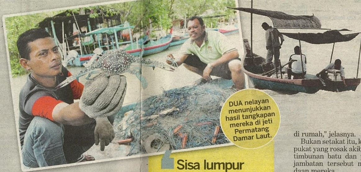
DUA nelayan menunjukkan hasil tangkapan mereka di jeti Permatang Damar Laut.