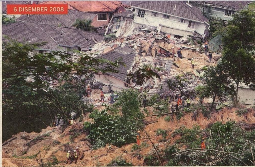
LIMA orang terkorban dalam kejadian tanah runtuh di Taman Bukit Mewah dan Taman Bukit Utama, Hulu Klang.