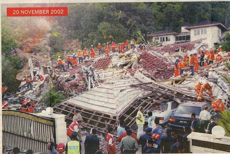
LAPAN orang terkorban apabila banglo dua tingkat milik bekas Panglima Angkatan Tentera, Jeneral (B) Tan Sri Ismail Omar di Taman Hillview, Ampang ranap dihempap tanah runtuh.