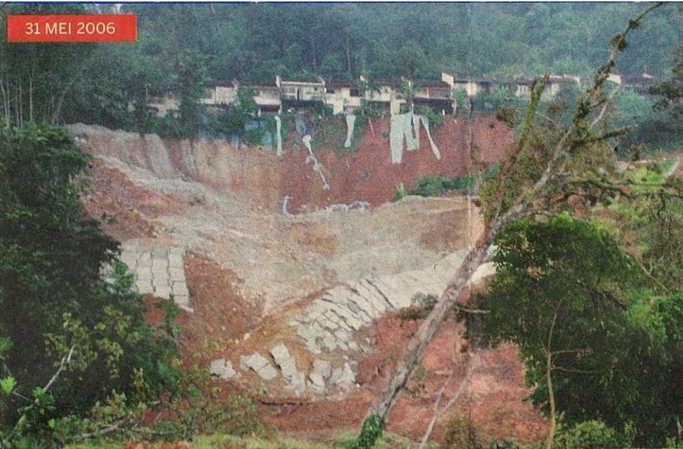
EMPAT orang terkorban dalam kejadian tanah runtuh di Kampung Pasir, Hulu Klang.