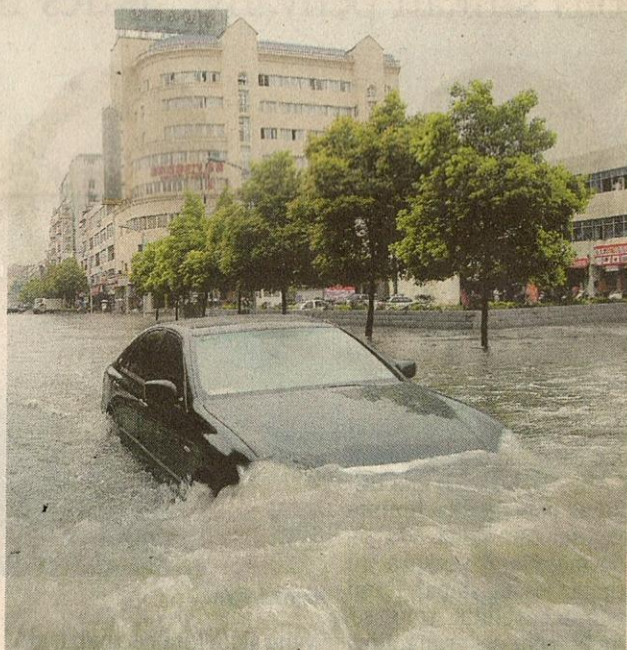
SEORANG pemandu meredah banjir di Yingtan, wilayah Jiangxi, semalam.

China Daily melaporkan, sembilan pegawai di Wilayah Autonomi Guangxi Zhuang dikenakan denda kerana mengabaikan tugas berkaitan banjir termasuk seorang pemantau empangan ditangkap dan didakwa cuai dalam menjalankan tugas kerana bermain pakau. - AP