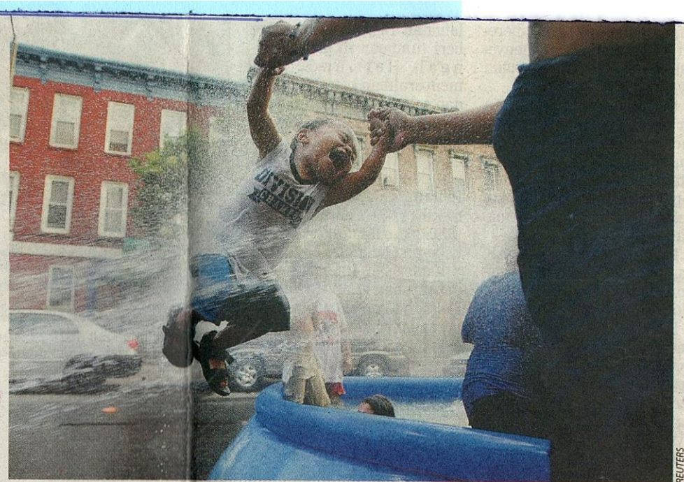
SEORANG wanita menghayun seorang kanak-kanak di pancutan air ketika gelombang panas di Brooklyn, New York.

Pakar kaji cuaca menggelarnya gelombang panas, berikutan suhu melebihi 37.7 darjah Celsius selama lebih tiga hari berturut-turut. Bandar raya terbesar di New Jer-