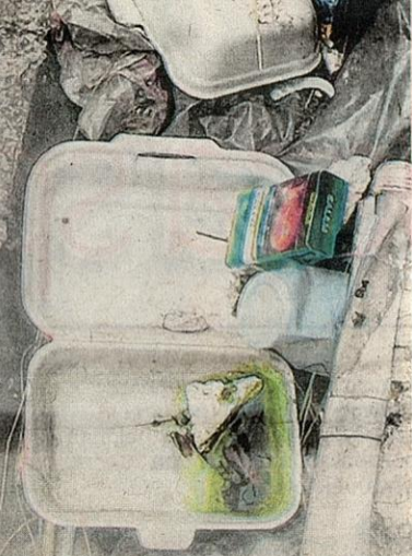
BEKAS polistirena, kotak rokok dan botol minuman keras memenuhkan sebatang longkang di Desa Setapak, Kuala Lumpur.