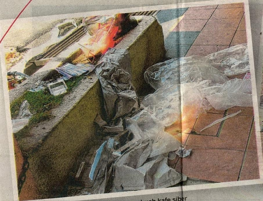
SAMPAH sarap berselerak di hadapan sebuah kafe siber di sekitar Jalan SS 21/39, Damansara Utama.