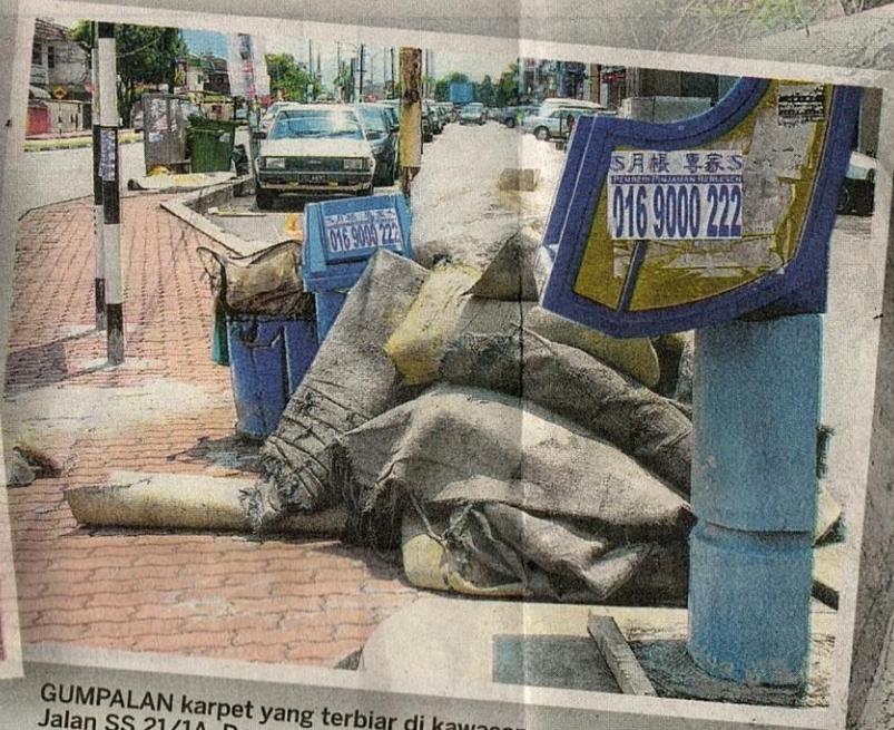
GUMPALAN karpet yang terbiar di kawasan Jalan SS 21/1A, Damansara Uptown, Petaling Jaya.