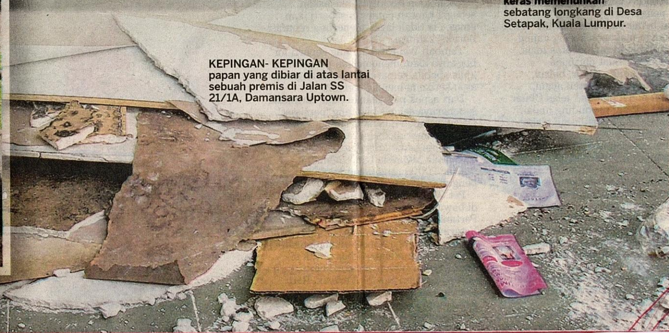
KEPINGAN-KEPINGAN papan yang dibiarkan di atas lantai sebuah premis di Jalan SS 21/1A, Damansara Uptown.