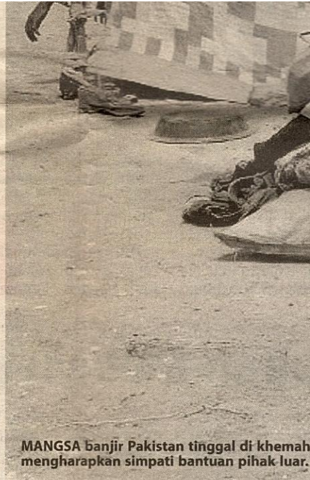
MANGSA banjir Pakistan tinggal di khemah mengharapkan simpati bantuan pihak luar.

Kemusnahan itu mengakibatkan mangsa banjir yang mahu terus menetap di pinggir sungai berkenaan terpaksa