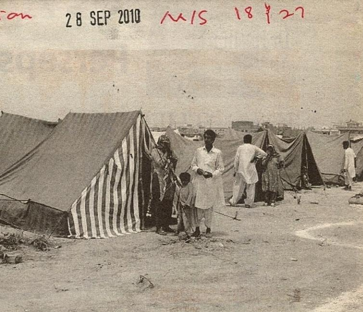
antara mangsa banjir di Pakistan.