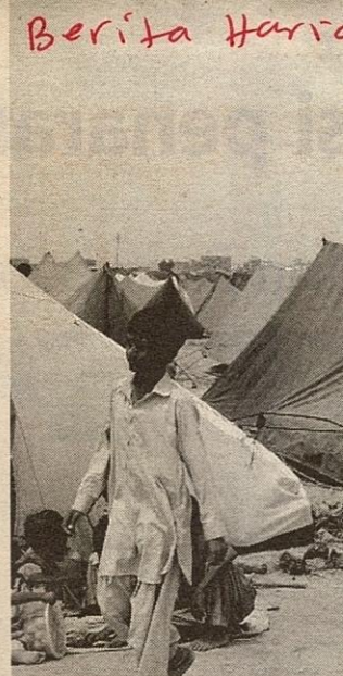
MANGSA banjir di sebuah kem penempatan sementara di Karachi menyediakan makanan.