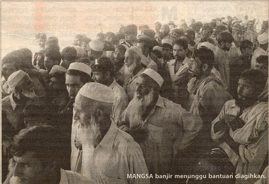
MANGSA banjir menunggu bantuan diagihkan.

Antara punca banjir besar itu berlaku disebabkan ketiadaan sistem perparitan yang sempurna, mungkin juga Pakistan menjangkakan bahawa negara itu tidak menerima hujan banyak dan sentiasa kering membuatkan mereka tidak membina sistem saluran sempurna.