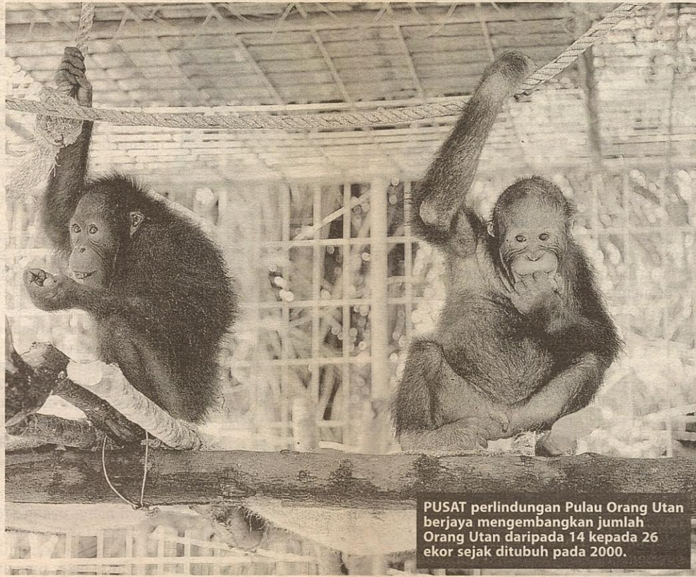
PUSAT perlindungan Pulau Orang Utan berjaya mengembangkan jumlah Orang Utan daripada 14 kepada 26 ekor sejak ditubuh pada 2000.

Tahun lalu saja, ada tiga seminar dan bengkel yang diadakan untuk merealisasikan matlamat itu yang semuanya boleh dilabelkan sebagai seminar peringkat antarabangsa kerana membabitkan pakar dari pelbagai institusi seluruh dunia. Ia sekali gus mencerminkan betapa komitednya yayasan itu untuk memastikan usaha mereka selama ini bukan