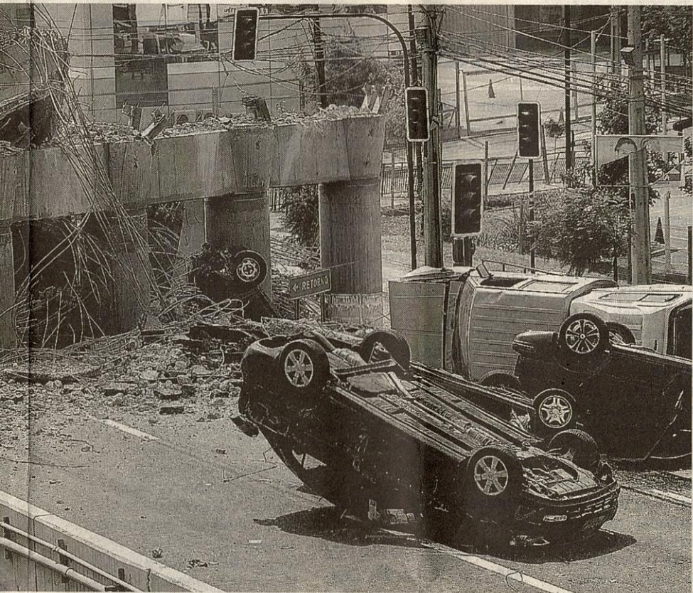
lebih raya yang runtuh akibat gegaran gempa bumi di Santiago, Chile pada Februari yang turut