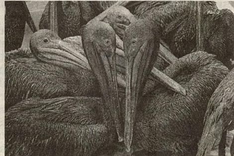
BURUNG undan ini diselaputi minyak akibat tumpahan minyak BP di Teluk Mexico.