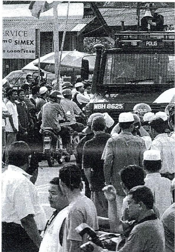
CARA dan keadaan kempen di Malaysia boleh menjadi lebih